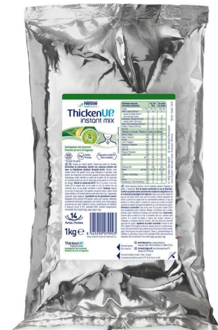
ThickenUP instant mix